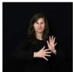
signer (parler en LSF)